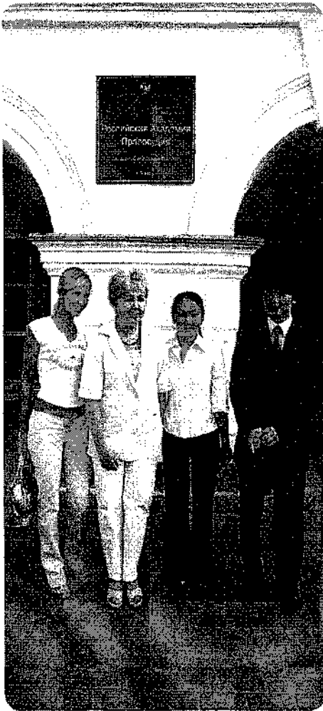
Академия: становление традиций. Учиться у нас интересно.

О традициях и событиях в Академии: во-первых, это День знаний - Первое сентября. Отмечает его Академия своеобразно. Первого сентября все приходят нарядные и красивые: и студенты, и преподаватели, с цветами, само здание украшено. Обязательно проходит праздничный концерт. В прошлом году, например, выступали артисты Драмтеатра, танцевальные коллективы, пели песни, теплые слова говорили студенты и преподаватели. Мне запомнилось это как большой красивый фестиваль. Все